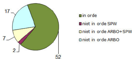
Resultaat van de inspecties

Bij twee inspecties was er sprake van gevaar of hinder voor het spoorverkeer. In zeven gevallen was er zowel sprake van risico voor het spoorverkeer als aanrijdgevaar voor personen.