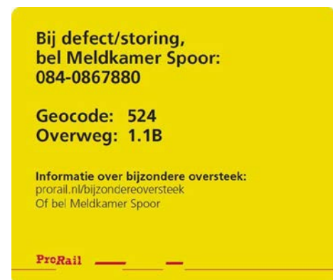
Figuur 3 voorbeeld van sticker om overweggebruikers te informeren over een bijzondere oversteek

ProRail heeft aanbeveling 3 voortvarend opgepakt. ProRail heeft een proces ingericht voor een bijzondere oversteek 15 . ProRail heeft haar procedure voor exceptionele transporten afgestemd met de RDW 16 en de vernieuwde procedure is via de RDW aan de brancheverenigingen gemeld. Overweggebruikers worden door middel van stickers (Figuur 3) op de paal van de overwegbomen/lampen geïnformeerd over deze procedure. ProRail verwacht dat eind 2018 alle overwegen van deze informatiesticker zijn voorzien.