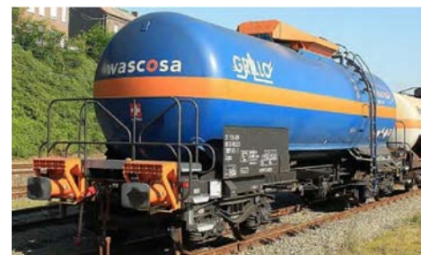
Figuur 1 voorbeeld van overbufferingbeveiliging (oranje) in combinatie met crashbuffers

De inspectie vindt het positief dat de chemiebedrijven: SABIC, OCI Nitrogen en AnQore in lijn met aanbeveling 2a geen operationele lastminutewijzigingen meer doorvoeren. In hun onderzoek naar de risicobeheersing van het vervoer van